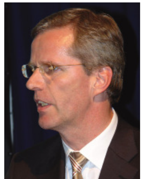
MdB Clemens Binninger

Der Anstoß zu diesem Vertrag sei im Jahr 2003 von Bundesinnenminister Otto Schily und dem Justizminister aus Luxemburg gegeben worden. In 2005 wurde der Vertrag von sieben Ländern abgeschlossen.