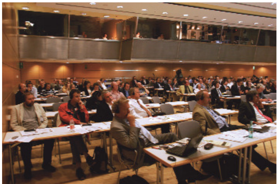
Blick in das Publikum

BKA-Präsident Ziercke stellte diesbezüglich abschließend fest, dass man die Sicherheitsarchitektur neu überdenken müsse.