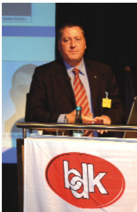
Werner Schuller, Interpol

kämpfung der mafiösen Strukturen erweist. Auch hier zeigt sich, dass diese italienischen Polizeibehörden eher nebeneinander her arbeiten als miteinander. In Deutschland waren im Dezember 2007 672.352 DNA Profile eingestellt. Die Engländer haben den höchsten Stand der DNA Profile in Europa mit ca. 5.000.000. Leider hat die Bundesrepublik Deutschland nach Auskunft von Werner Schuller bisher nur 298 dieser DNA Profile in die DNA Datenbank von Interpol eingestellt. Alleine daraus haben sich 9 Treffer ergeben. Auch Frankreich hat nur 51 DNA Profile an Interpol gemeldet, Italien sogar lediglich 21. Herr Schuller beklagte, dass die Möglichkeiten, die sich für die Verbrechensbekämpfung aus gemeinsamen Datenbanken bei Interpol ergeben, auch noch nicht in Ansätzen genutzt sind. Interpol strebe deshalb einen Ausbau seiner weltumspannenden DNA-Datenbank an, in die heute schon 20 Länder online Daten einstellen können. Allein beim Datenabgleich zwischen Österreich und Spanien im Rahmen des Vertrages von Prüm sei es zu 143 Treffern gekommen. Herr Schuller wird über den Stand der DNA Datenbank von Interpol in einer der nächsten Ausgaben von „der kriminalist“ berichten.