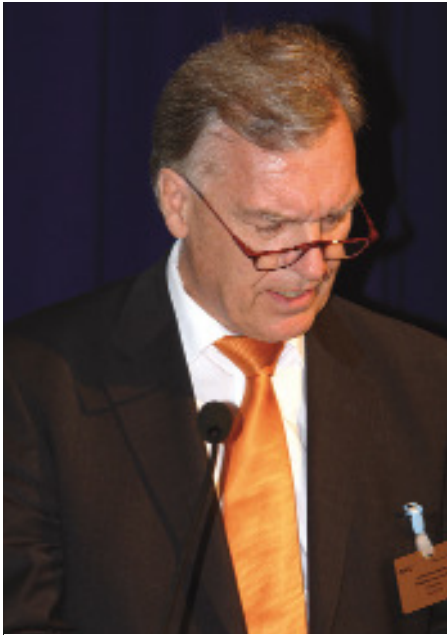
BKA-Präsident Jörg Ziercke

klären. BKA-Präsident Ziercke machte deutlich, dass er die Ermittlungen im Bundeskriminalamt verstärkt hat und dass allein im BKA 42 OK-Verfahren bearbeitet wurden.