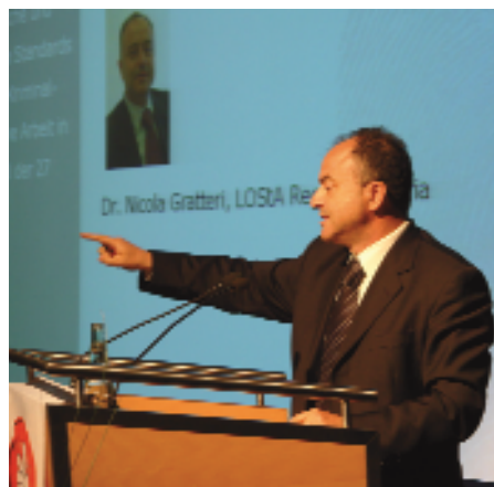
Dr. Nicola Gratteri , LOStA Reggio Calabria

Die örtlichen Ndrangheta-Bosse benehmen sich nach Angaben des LtD. Oberstaatsanwaltes wie ein Hund, der das Terrain markiert. Sie grenzen ihr Revier mit Schutzgelderpressungen ab. Die Dreistigkeit, mit denen bei Ausschreibungen vorgegangen wird, sei beispielhaft. So würden z.B. alle Angebote der unterschiedlichen Unternehmen auf einer Schreibmaschine geschrieben und untereinander abgesprochen, wer gewinnen darf und welche prozentuale Beteiligung es gibt. Die Organisation verdient auch ihr Geld mit Wucherzinsen, was die Abhängigkeit von Kredithaien von Leuten fördert, die in hohen gesellschaftlichen Stellungen, als Lehrer, Rechtsanwälte, Ärzte, usw. tätig sind. Will in Süditalien z.B. jemand 100.000 Euro bei den Ndrangheta aufnehmen, erhält er nur 70.000 davon, da 30.000 bereits Zinsen sind. Bei Nichtzahlung folgen Bedrohungen, Prügel, Beschädigung der wirtschaftlichen Existenz. Es kommt auch dazu, dass alte Ladenbesitzer, die sich bei