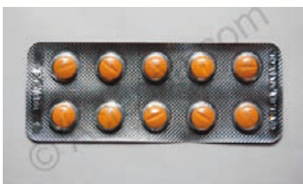
"Tabletten" aus Islamabad

ser Adresse existent ist, die Adresse befindet sich in den Slums von Islamabad in Pakistan.