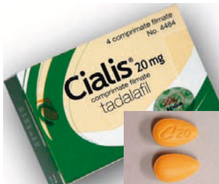
Cialis ist in Österreich rezeptpflichtig

Pro Bestellung investierten wir ca. 150 bis 200 Euro, bezahlt wurde mit Kreditkarte, denn ohne Kreditkarte geht es nämlich nicht. Nicht nur, dass wir unsere sensiblen Kreditkartendaten irgendwohin schicken mussten, wo wir nicht einmal einen Firmensitz oder zumindest den Staat des Anbieters erkennen konnten, mussten wir dann warten, ob überhaupt irgendeine Lieferung kommt.