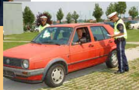
unten: Praxisstraining - Anhaltung eines Verkehrsteilnehmers

Brigadier Karl-Heinz Grundböck, Leiter des Zentrums für die Grundausbildung der SIAK.