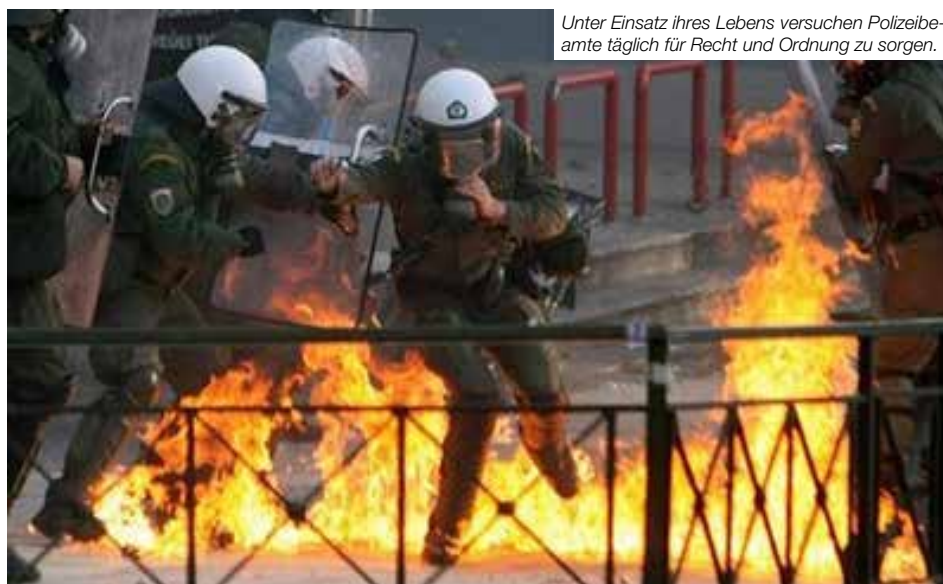
Unter Einsatz ihres Lebens versuchen Polizeibeamte täglich für Recht und Ordnung zu sorgen.

Fußballgegner sehen den Grund in der aufgeheizten Atmosphäre der Stadien, Com-