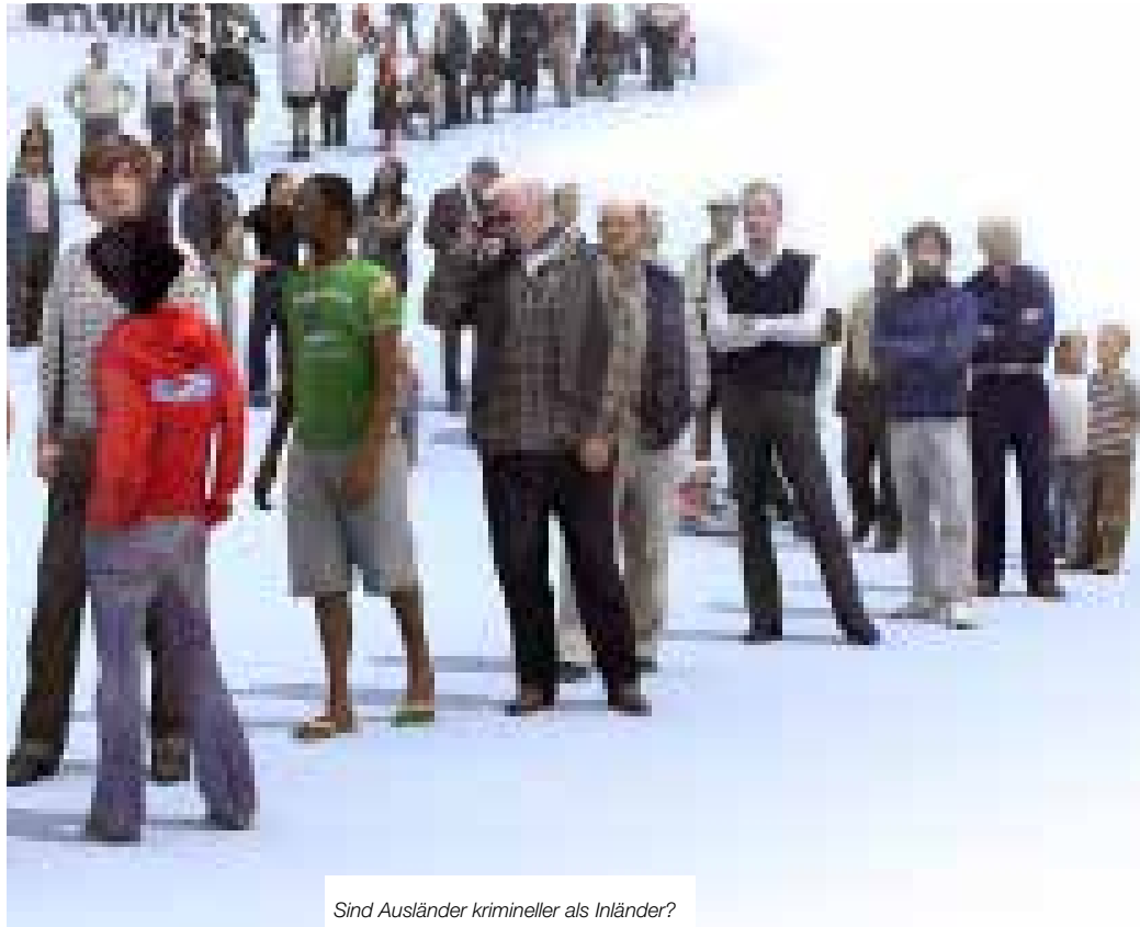
Sind Ausländer krimineller als Inländer?

Noch eine Zahl zur Gegenüberstellung: 1975 waren österreichische Jugendliche mit 9,1 %, ausländische mit 0,3 % an den Gesamtverurteilungen beteiligt.