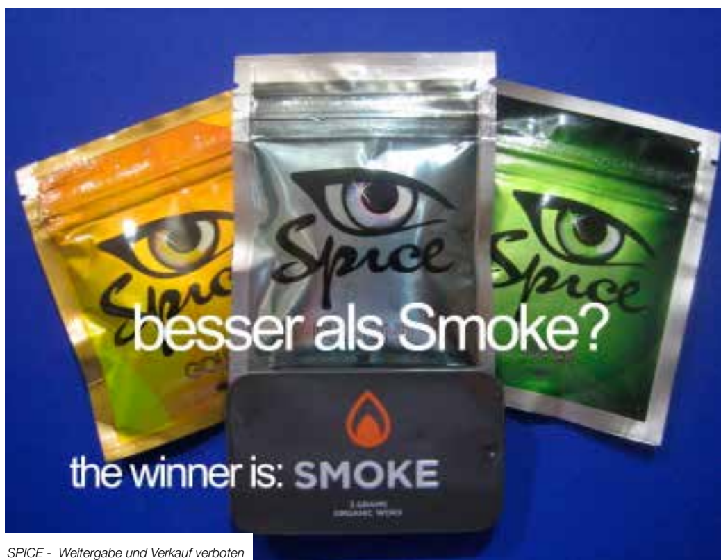
SPICE - Weitergabe und Verkauf verboten

Die in SPICE enthaltenen synthetischen Cannabinoide um ein Vielfaches potenter als THC. Dadurch werden auch nur geringste